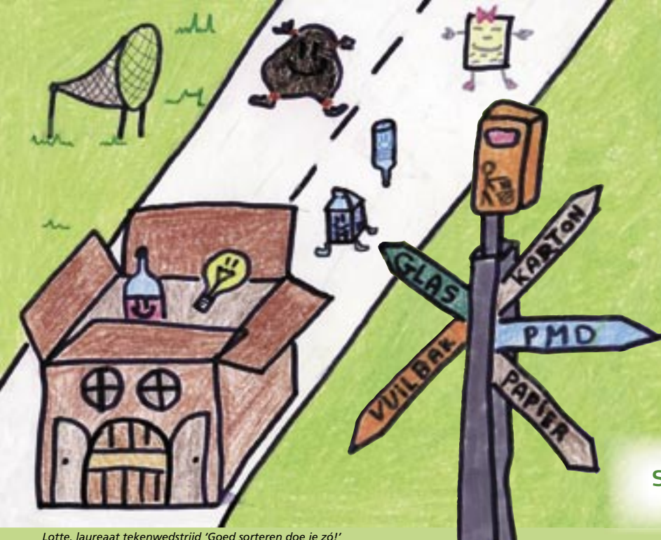
Lotte, laureaat tekenwedstrijd 'Goed sorteren doe je zó!'